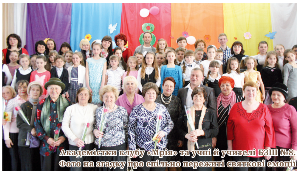
Академістки клубу «Мрія» та учні й учителі БЗШ №8. Фото на згадку про спільно пережиті святкові емоції

лишатися справжніми берегинями своїх родин, даруючи оточуючим посмішки й позитивні емоції, випромінюючи віру, надію, любов!